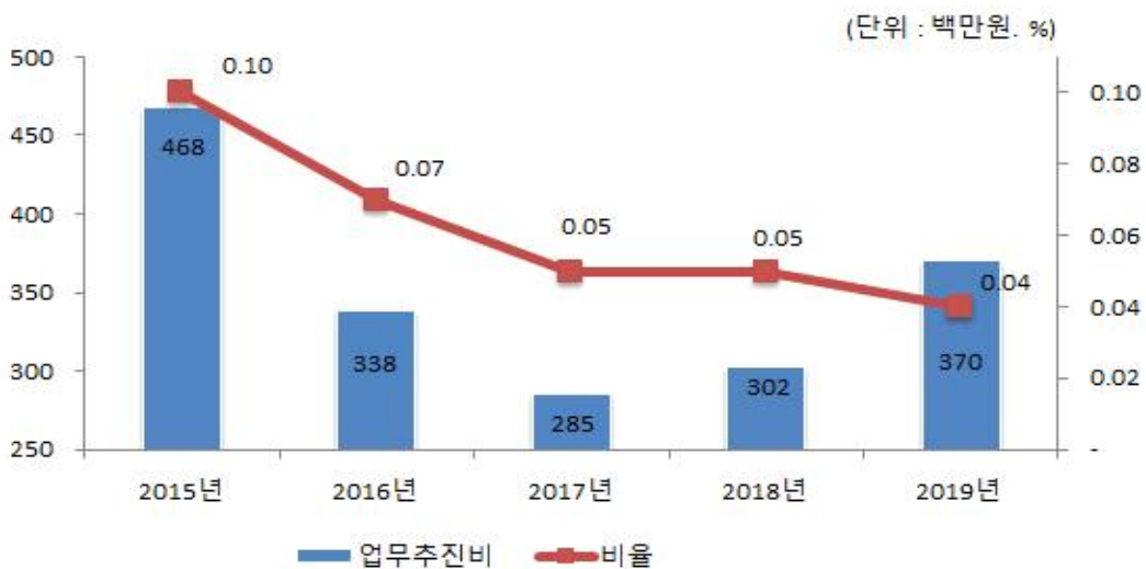
업무추진비 연도별 변화

☞ 업무추진비는 한도 내에서 편성하고 있으며, 2018년에 비해 70백만원 늘어남