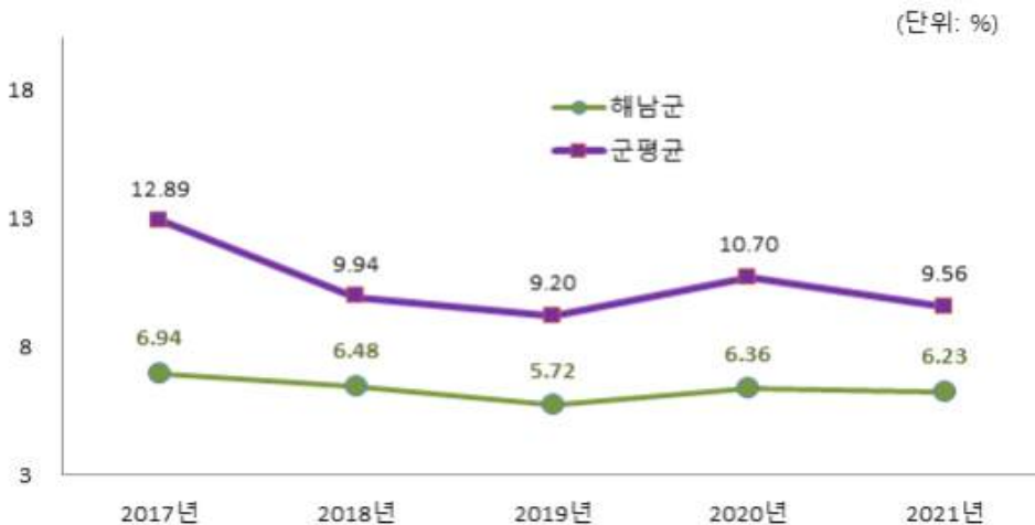
유형 지방자치단체와 재정자립도 비교