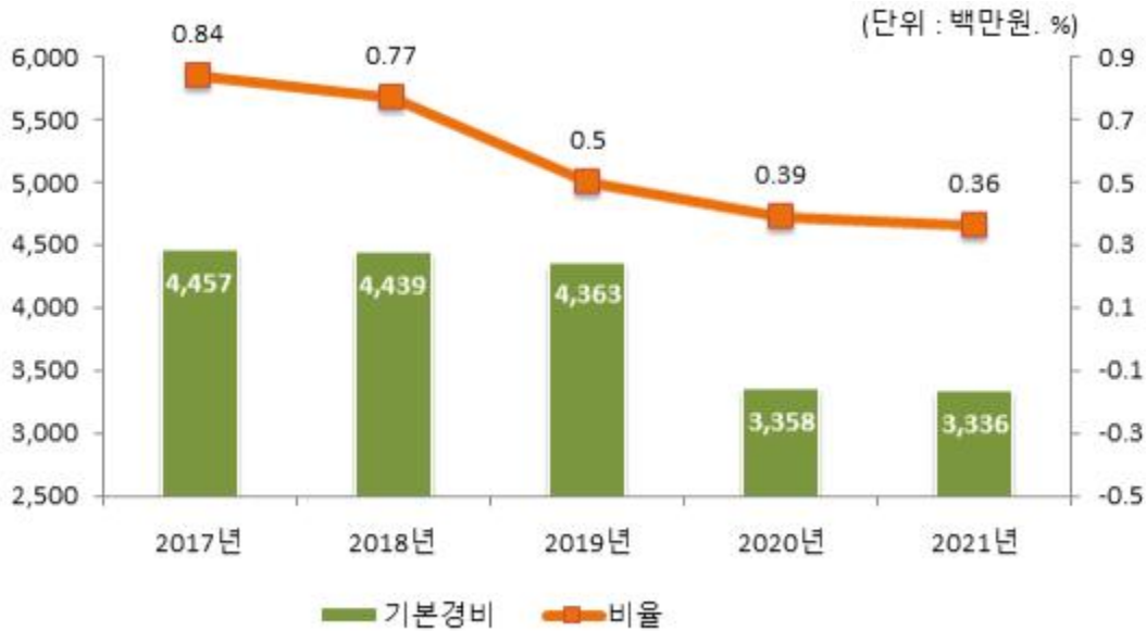
기본경비 연도별 변화

☞ 2021년도 기본경비는 3,336백만원으로 2020년도에 비해 22백만원 줄었으며 세출결산액과 비교하여도 기본경비 비율이 0.39%에서 0.36%로 낮아짐