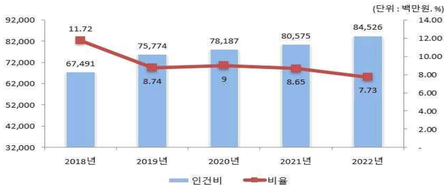
인건비 연도별 변화