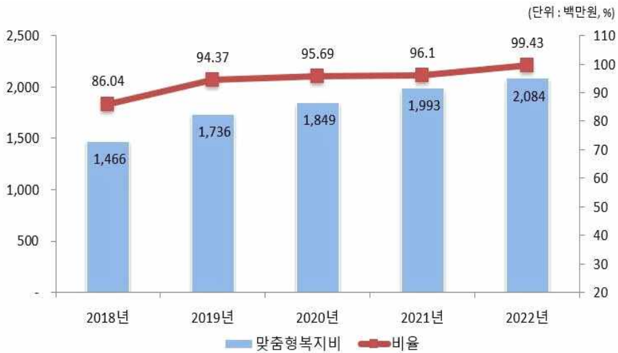
맞춤형복지제도 시행경비 연도별 추이